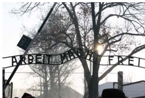
L'ingresso del campo