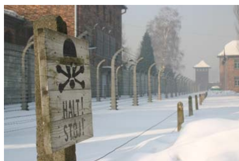
A sinistra il muro dove venivano giustiziati i deportati, sopra i reticolati

Persino il gelido inverno polacco sembrava essere diverso tra quelle mura che risuonano ancora di dolore, di disperazione, di passi strascicati con zoccoli di legno. Ma ancora più grande e dolorosa è la sensazione che abbiamo provato nell'ingresso di Auschwitz 2 – Birkenau, situato in aperta campagna su di un'area di enormi dimensioni, dall'ingresso non si vede la fine. Sulla destra la sezione maschile, sulla sinistra quella femminile. La prima fila delle baracche di legno perfettamente mantenute dal governo polacco ci ha permesso di constatare quali inumane tribolazioni dovevano sopportare i deportati. Resti di alti camini in muratura testimoniano la presenza di altre baracche di legno oramai cancellate dal tempo ma rendono giusta dimensione dello spazio. Il cammino verso il sito dove risiedono le camere a gas e i forni crematori perennemente accesi è stato compiuto con l'animo grave, ascoltando il rumore della neve sotto i nostri piedi, la stessa calpestata da quei poveri disgraziati che, molte volte ignari andavano incontro verso il loro tragico destino.