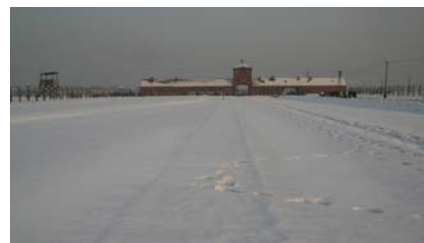
L'ingresso di Auschwitz 2 Birkenau Sotto il campo femminile

A destra l'immagine di ciò che resta dei forni crematori.